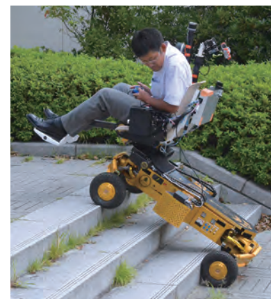
サイバスロン2020 出場機体 "RT-Mover PType WA Mk-II"