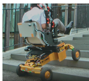
「RT-Mover PType WA MK-II」