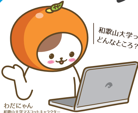
わだにゃん 和歌山大学マスコットキャラクター

新型コロナウイルス感染症の影響で世の中が大きくかわろうとしています。そこで「 ニューノーマル時代における和歌山大学の産官学連携活動を再考する 」をテーマとして、和歌山大学に対する産官学連携活動に求められている課題に焦点をあてたバーチャル交流会を開催します。