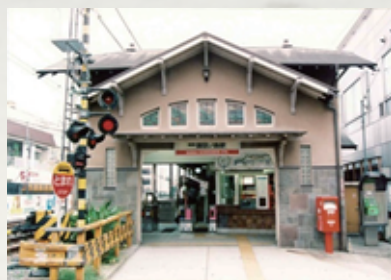
諏訪ノ森駅（堺市）大正／1919 木造平屋建、建築面積 48 m 2 、1 棟 1998 年 9 月指定