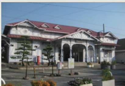
浜寺公園駅（堺市）駅舎：明治／1907 木造平屋建、鉄板葺、建築面積 249 m 2 、1 棟、 1998 年 9 月指定