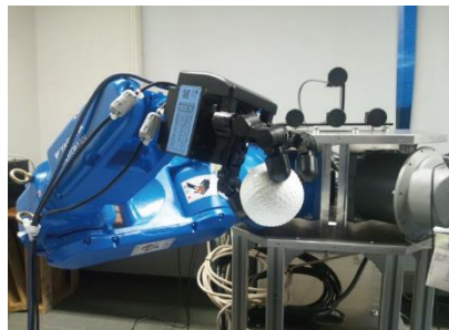
ハンド・アームシステム

物体の捕獲～ 運搬～設置ま での一連の作 業を、一つの コントローラ で実現します。