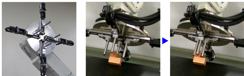
汎用ロボットハンド（試作機）と部品の把持

ハンドの機構は低自由度で比較的簡単であり、制御も容易であるため、低コストながらも変種変量生産に大きく寄与することが期待されます。