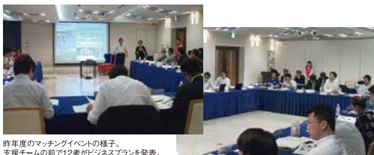
昨年度のマッチングイベントの様子。 支援チームの前で12者がビジネスプランを発表。