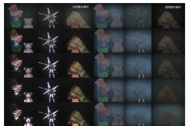
光投影による光沢感と透明感の実時間操作

本件に関するお問い合わせ：liaison@ml.wakayama-u.ac.jp