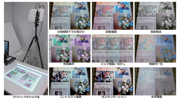
プロジェクタカメラ系による見かけの制御