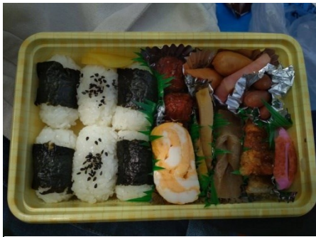
野外礼拝のお弁当 家族に会いたくなった。

先月、教会の野外礼拝に参加したときのことだ。あるおばあちゃんがわざわざ私のためにお弁当を作ってくれた。唐揚げ、卵、ミートボール、こんにやく、ソーセージ、ハム。小食の私だけれども、あの時、意外とたくさん食べられた。学校に行く前にお母さんが作ってくれたお弁当を思い出したからかもしれない。国が違っても、母親の役目はいつでも同じで、家族を守ることだと思う。