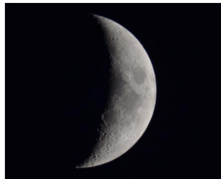
望遠鏡を通して見た月齢5の月