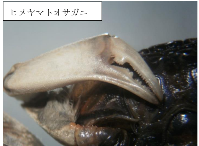
ヒメヤマトオサガニ