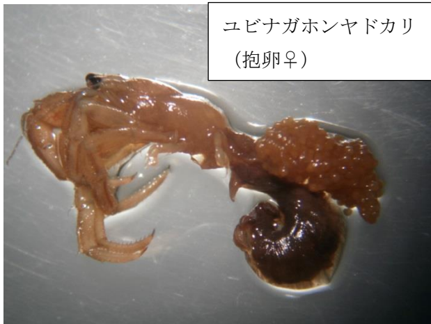
ユビナガホンヤドカリ (抱卵♀)