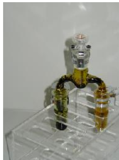
拡散法による結晶成長