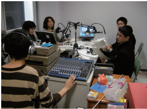
写真-1 荒川防災ステーションの収録風景

加わり、総勢16名の生徒が番組制作に参加した。当初、スタッフの一員として多くの教師の参加することが望ましいと考えていたが、教師が多忙なこともあり、あえて教師は参加しなくても良いと考えた。そのようなことから、校長と「防災ステーション」担当の教師（1名）がスタッフの一員として参加した。地域の防災ボランティア（3名＝防災に関する知識は持ち合わせていない、以後、ボランティアと略す）が地域住民の代表として番組制作に参加した。筆者は、作成された台本のチェックを行い、毎回、番組の録音にも立ち合い、番組制作全般にわたり支援を行った（写真-1）。