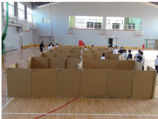
写真-2 和歌山大学で制作した間仕切り