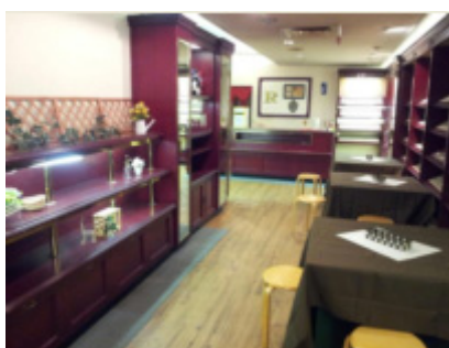
図2 以前のテーブルセット