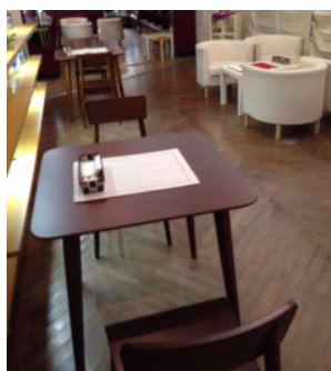
図3 新しいテーブルセット