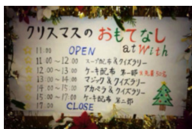
図6 クリスマスカフェ