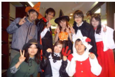
図5 ハローウィンイベント